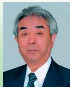
新潟大学名誉教授、 新潟医療福祉大学名誉教授 (専門は精神医学・心身医学)