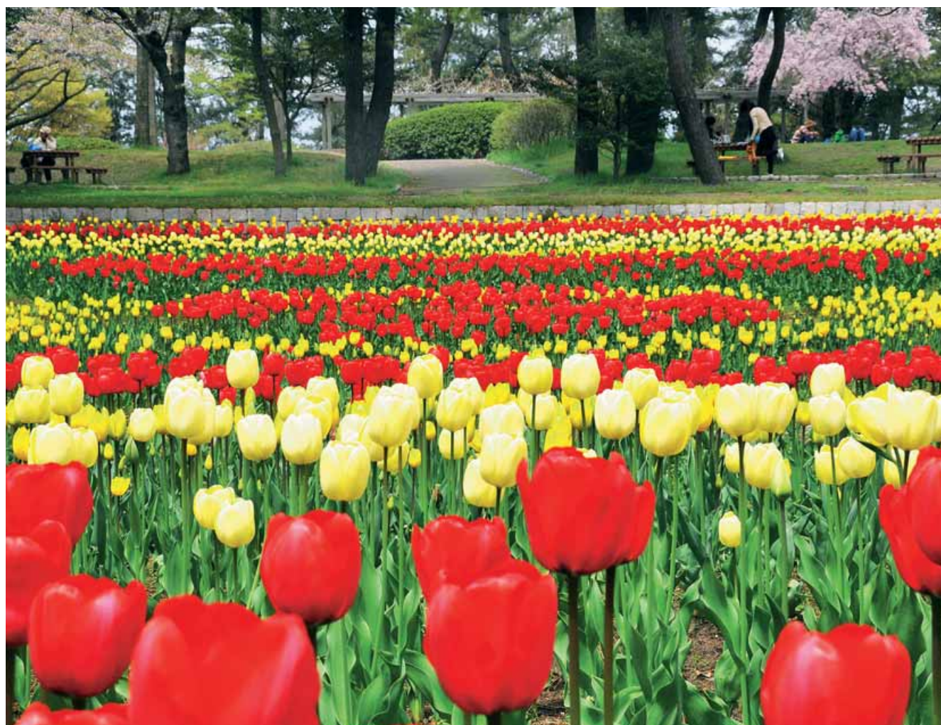
チューリップ畑 寺尾中央公園（新潟市）