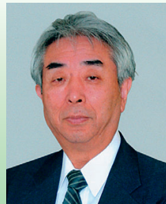
新潟大学名誉教授、 新潟医療福祉大学名誉教授 (専門は精神医学・心身医学)

この「精神」と「こころ」は同じもの、同じ内容のものなのでしょうか。辞書を引くと、同じようである、全く同じとは説明してありません。