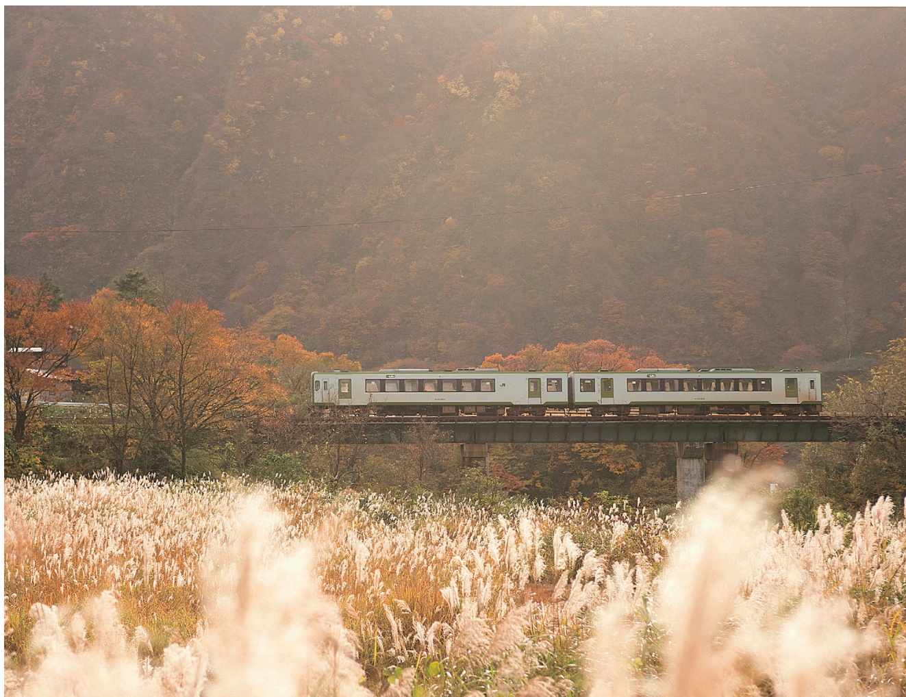
米坂線 ススキと電車（新潟県関川村）